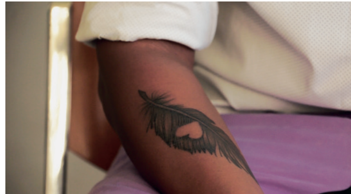
The Future Is Now! by Afro Rainbow Austria – ARA & Petja Dimitrova (2018)

Ausgehend von einer spezifischen, dem Mexikoplatz impliziten Erinnerung – jene an das Asyl, das Mexiko Tausenden Menschen auf der Flucht vor der nationalsozialistischen Verfolgung gewährte – holen Filmemacher_innen und Künstler_innen die Thematik Migration | Exil | Flucht in den Kontext der Gegenwart. Sie richten ihren Blick auf aktuelle Situationen (eigens) durchlebter Migrationsgeschichten, entwerfen mögliche Erzählformen dieser Erfahrungen und zeigen Schnittstellen zwischen diesen durch Zeit und Raum scheinbar voneinander getrennten Geschichten.